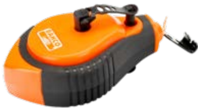
Slaglijnen, 3x terugspoelsnelheid, 30m CL-1221