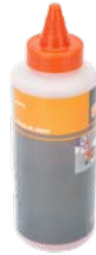
Kalkvulling, 227 gr. CHALK-BLUE